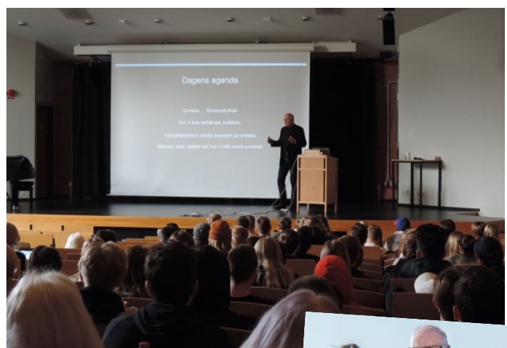
Berättelsen om Raoul Wallenberg engagerar gammal som ung.