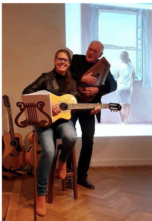
Även våra lättsamma musikframträdanden går under ambitionen "bildande underhållning"