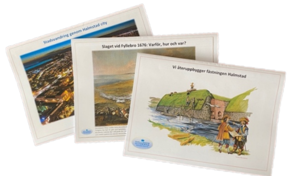
Med Hallandsguidernas populära skrifter kan Du gå tillbaka och friska upp minnet kring allt det spännande som berättades – eller dela med Dig till vänner.