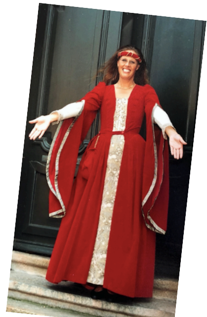
Vid guidningar i Halmstad slott är tidsenlig klädsel obligatorisk för oss.